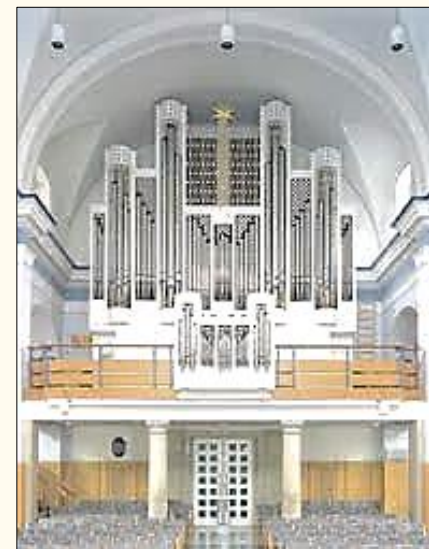
Orgle v Zavodu sv. Stanislava

Letos praznujemo tudi 25-letnico zavodskih orgel. Prisluhnil bomo skladbi Wir danken dir Gott , skladatelja J. S. Bacha.