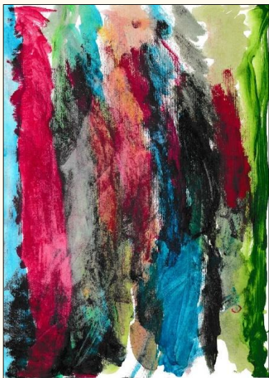
Izakova risba – »V E S E L J E«

Spoštovane in spoštovani obiskovalci slavnostne akademije 2024, lepo pozdravljeni!